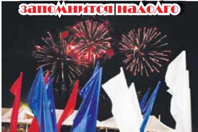
Окончание. Начало на стр. 1, 2, 3.