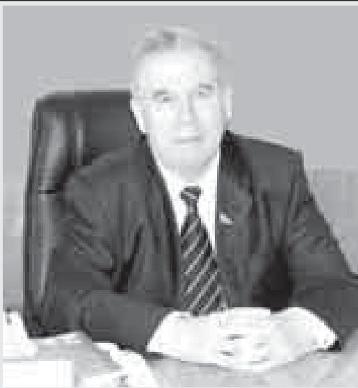
Бёлюмлер, миллет, география жаны бла энчиликери да барды. Къабарты-Малкъарны юсюнден айтсакъ, бизде промышленностьха, эл мюлк эм туризм сфералагъа асламыракъ мағана бериледи деге боллукъду.

Алай мында не иги законла эмда умутла болсала да, аланы тамамлау адамлагъа кереки. Дагъыда, айтханыбызча, хар регионну кесини экономикасында тёрели (кючлюрек)