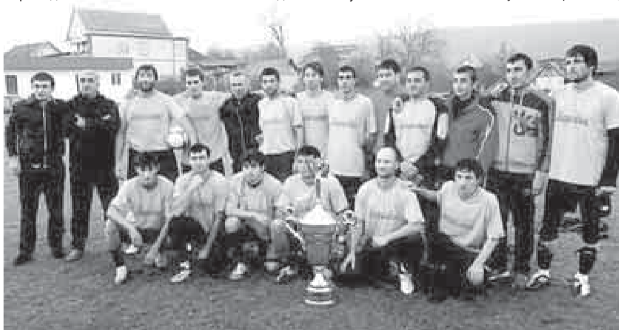
«Логоваз» футбол команда.

Тренер Туменланы Хусейни «Бастиян» клубун энчи айтыр-Туменланы Бийберт 2014 жылда Болгарияда боксдан дуняны биринчилигинде алчы болганды. Бёзюланы Ислам бла Харун боксдан Россейни призёрларыдыла. Туменланы Альбертти уа Россейден тышында да иги танийдыла. Хар сермешинде хорлам келтирген жаш бла битеу малкъар халкъы,