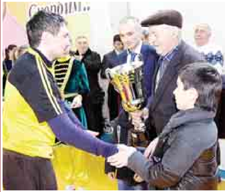
Ануар хорлаган команданы капитанын алгышлайды.

ишли кереме. Ол урунуу жолун тау-байыкландырыуу комбинатда мастер болуп башлап, республикада бек улуу предпритияладан бирине таматалык да этгенди. 2009 жылда производство учреждение Россейде «Жол мюлкюню эм транспорт кыгулушну бөлүмюнде бек ири организация» деген сыйлы атха тийишли болганды.