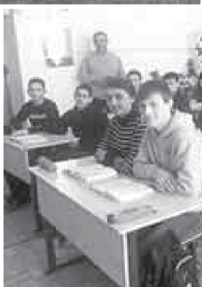
Школда дерс барган кезиу.