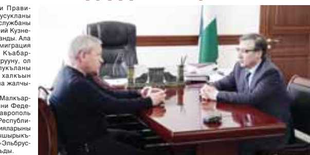
КъМР-ни Башчысыны бла Правительствоосуна пресс-службасы.