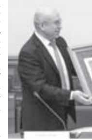
араны таматасы кыонакыгыз да, ложение Петербурга» деген гравюраны бла черкесилени юсюндөн Иорданияда арап типде басмаланган китапны бергендиле.