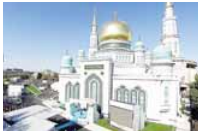
архитектура эм башха энчи экспонатлары бла шагъарейленгенди. Ахырында эсе калылык саугъала берилгендиле. Юрий Коков Россияни Муфтилерини советини председателин Къабарты-Малкъарга къонакъга чакъырганды.