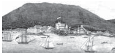
19 ёмюрде чыкыгъан орус открытокдан репродукция.

Сёзюсю, патчах правительство келлик заманнга кыараялык тоюлю эди. Алай геополитика жаны бла Новоархангельскни (Орус Американы ара шахары -бусагъатда Ситка шахар) сатыу ол уллу аманлыкчылыкды.