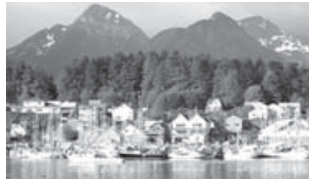
Орус кёчгюнчюле Аляскада кыурагъан Новоархангельскге америкалыла Ситка деп атагъандыла.

Ким чабарыкъ эди ол заманда Аляскагъа? Ёмюрню ахыр жылларында Граждан урушдан кеси кеслерине келалмай тургъан америкалыламы? Неда японлуламы? 1905 жылда Япон-орус кызауатдан сора ала Сахалинни кыбыла жанын сермеялгъандыла (1945 жылны августунда аны да артка кыайтаргъанбыз).