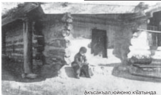
Акьсакьал юйюно къатында.