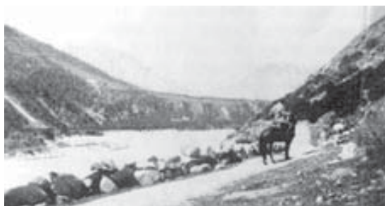
Бахсан ёзен эм Тонгуз-Орун.

Андан сора да, аны бек уллу умутлары бардыла, ол санда кеси бийлик этген Бахсан ёзенни туристле жюрюген маршрутларын картагъа туюшюрге. Алай а сюдлюк-