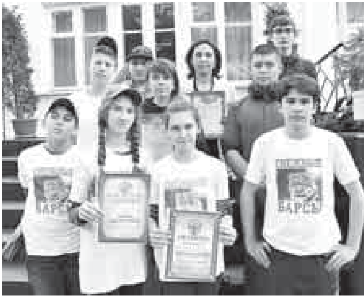
эмда башында сагъынылгъан араны атларындан дипломла бла грамотала бергендиле.

Тириликлерини, хорламгъа итинулюклерини, бир бирге билеклик эте билгенлерини хайырындан биринчи жерге Нальчикни тогъунчу орта школуну командасы тийишли болгъанды. Алагъа эмда башхалагъа эришиуну кѳурагъанла кѳауум министрстволаны