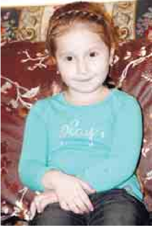
Къужонланы Элинагъа 4 жыл бла 9 ай болады. Къашхатау элденди. Тепсерге бек сюеди.