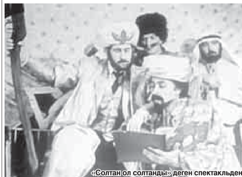
«Солтан ол солтанды» деген спектакльден.