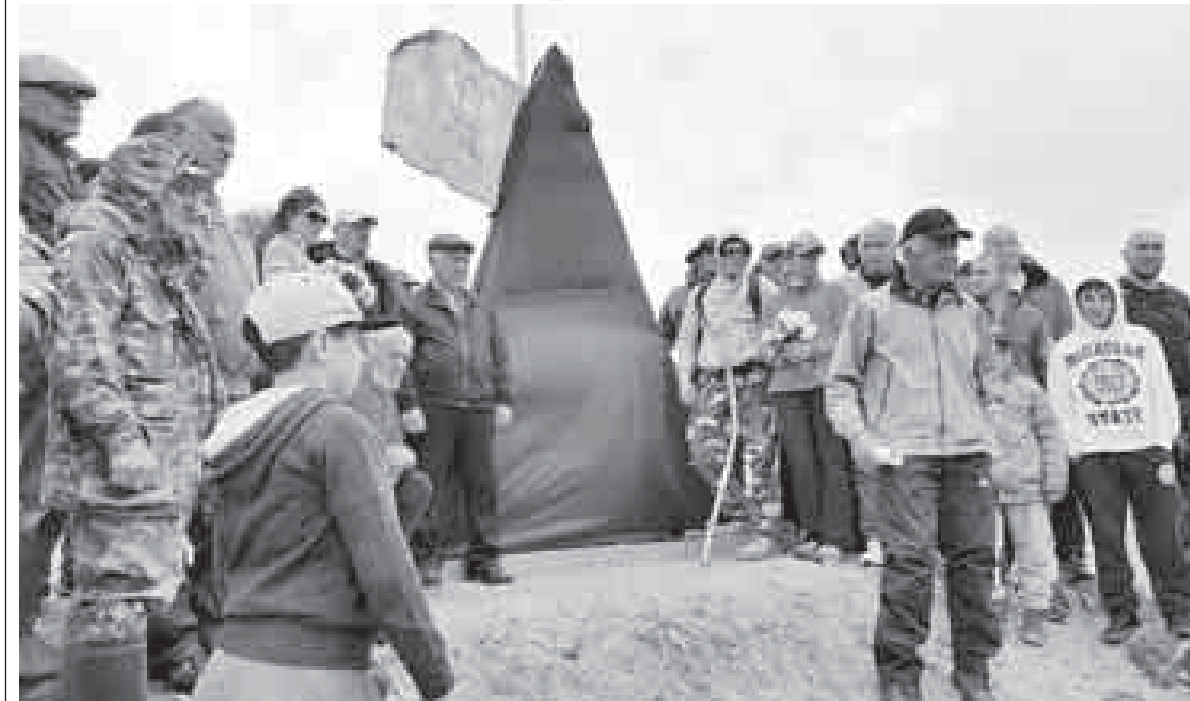
Ахыры. Аллы 1-чи бетдеди.

Хадис ол жерлени бек сюегенди, нёгерлери бла ары уугъа кёп кере барганды. Ма ол сюелин, тегерекде таулагъа, кыарлы къаалагъа кыарап тоялмагъан жерге орнатхандыла эсгертемени