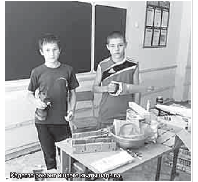
Кадетле ремонт ишлеге кыатышдыла.

взвозха юлешинедиле, ол бөлүмледе отуз чакълы бир адам болады. Аскердеча, ала барысы да бирге турадыла.