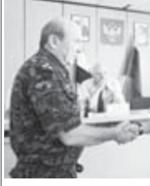
Быйылны биринчи жарымында шахарда оператив болуму юсюндөн баш доклады Управленийыны таматасы полицияны полковниги Теграланы Марат этгенди. Ол айтханыча, толтуруучу власть органла бла бирге Управленийыны подразделенияларыны куулукчулары республиканы ара шахарында кеп адам кыатышхан 609

РФ-ни МВД-сыны Нальчик шахарда Управленийыны пресс-службасы.