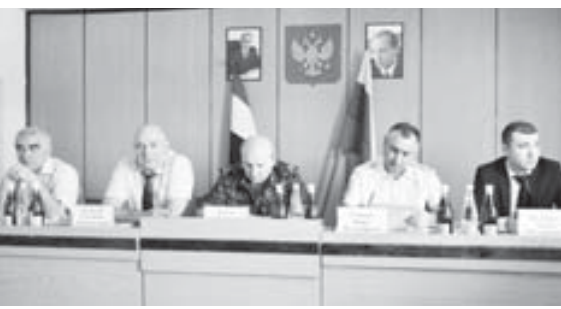
Аманлыккыла, орамлада, жамауат жыйылган жерде бузукулукла да кысарытылгандыла. Шахарда базарда криминал болуму тапаландыруу жумушла бардырылгандыла, жалган ичи затланы законлагы бузукулукла этип сатуугу тохтатуу жаны бла мадарла толтурулгандыла.