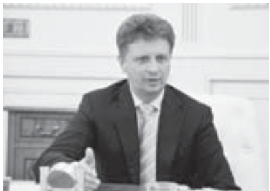
КъМР-ни Башчысыны бла Правительство суну пресс-службасы.

«Нальчик» аэропортда самолётла кьонунуу эмда учуучунызы жаггыртугьга, СКФО-ну эки субъектини – Къабарты-Малкъарны бла Ставрополь крайны жерлерни бла Тамбухан кёлине тегерек айланп этген автомобиль жолу Федерал бюджетни ыркысысн кьошуу бла ишлеуге аха бёлонорча онгла табарга келишим этилгенди. Жоллада кьоркьусуздукну жалчытуу жаны бла мадарланы кючлендириге кереклини юсюнден да энчи айтылганды.