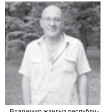
Владимир жангыз республикада угъай, саулал кыралды

Тёбен Чегем элде боксдан секция алгъаракълада ачылгъан эди. Ары жаруу этерге отуздан артык жаш адам, жорюйдю. Заман аз ётгенликте, алгъа атламлары уа тиридиле.