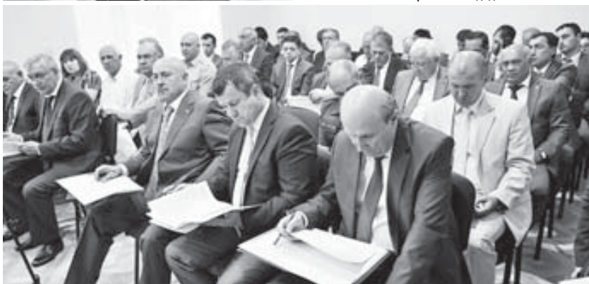
Ахыры 2-чи бетдеди.