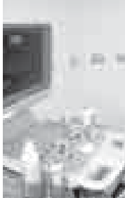
Республикалы сабий клиника больницада жыл сайын онбеш минг чакълы бир саусузга багъадыла. Анда УЗИ аппарат жетишмей келгенде бери кыйналады. Экиси бар эди да, бирде ю смен бла окушу ишлей эдиле. Аладан да бири 2011