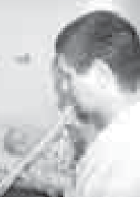
жылда модернизация программагъа керу алынган эди. Алай нейрохирургия, абдоминал, урология операцияланы кезиунде чып тошген жерин тынгылы кыргозтмегенди. Аны себели MindraeC-N3 фирманы шёндюлю заманын сурамына керу казырланган