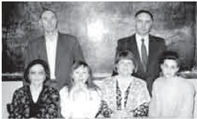
Бирге ишлеген нөгөрлери бла.

Биз да бу кюнледе Тетуу улу бла ушакь бардыргъанбыз.