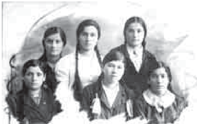
юйорю бла Яникойда тохташды. Быйыл апрельде ауушханды. Жаннет чырагы болсун.