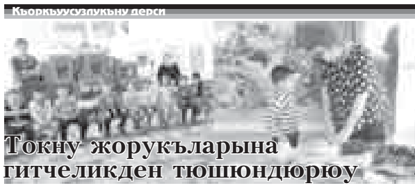
Къоркыуу салуукуну дерси