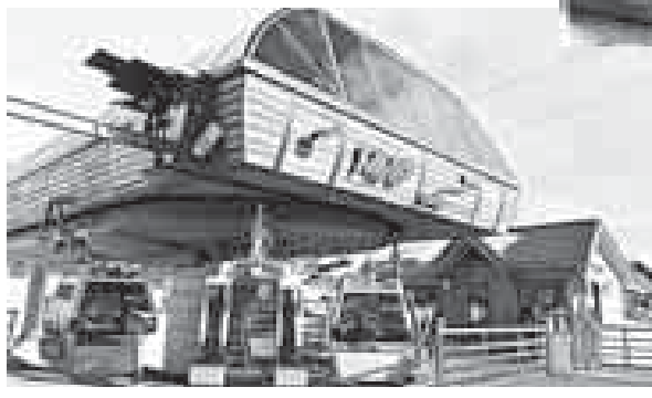
Россий Федерацияны Шимал Кавказы ишлери жаны бла министерствосуну материалларына кёре.