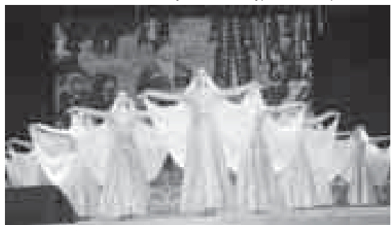
«Балкария» кърал фольклор-этнография ансамбль.

Алгъадан окъуна байрам концерт таза да тынгылы къралгъанын чертирге тийишлиди. Анда сахнада айтылгъан жыр бла къабыргъада кёрюзтюлген видеоматериалла бир бирге алай тап келишгенлерине ыспас, хурмет да этерчады.