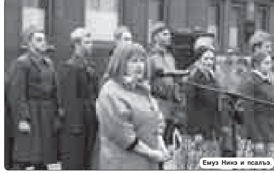
Emuz Nins и псалъ.

Абы зэлкърыхауэ штытсэлъыхащ кършым кышчыщах рудам елжэ предпрятэхэр республикым и шынэцлэм кышчыщэзэлэццым, Тырныуз и вольфрам-молибден кышчыщэпэхэр зегъэуэжыныр, технология нэхэ пэрты дьндэхэр кышчыщэзэлэццэм «КъБР-вольфрам» предпрятэр уоуном. Зман пухукалм кършымдыра ирагъэуэжыныр лүхүцлэм кызыррагъэлэгъуамкы, лажыгъэхэм дызэрты ильсым и махуэуэжы мазэм шадзэнущ. А предпрятэм ильсым продукчу тонн минн 4-м ноблагъэ кышчыгъэуэжыныр икыл кэралым и рынокыр флагъ лъагэ зилэ вольфрам ангридидик кызыррагъэлэццым.