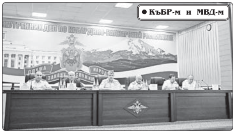
КъБР-м и МВД-м