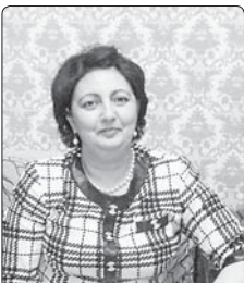
Нэфцэуэуи (Мураэкъан) Инессэ Исфур и лхур Филуэуи цыцхэлэжэ залушэуи.