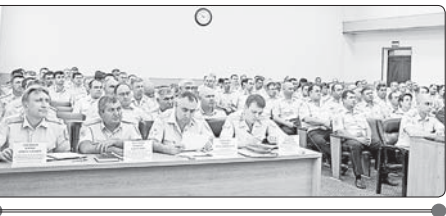
Къэрал Луэхуэуи цыцхэлэжэ залушэуи

КъБР-м Къэрал къуццэ Луэхуэмкцэ шцэ министрствэм и пресс-луахуэуи цыцхэлэжэ залушэуи.