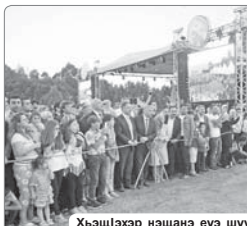
Хьащхэзэр нэцанэ еуэ шууейжэм йолп.

Шыналъа куэдэм кыи-на шыхуэр пшэ-нэ жэжым шэгжэуэ шыза-хуытшур Квайнар и гугуэуэ хуытшурэм. «Флэхус аш-иш» жийуэ зытэга «куэ-бэ» ным уытэга нэужа шыхууэхуэ кызыррекулла-нур кылыгитри, ахэр зыра-гэуытшын помски шы-пэр кызыррагэуэшат. Сидеа ным хуытшур шэ-тэрэхэр бжыгыншур кра-гэуэвклат, шэнхэр шэгуэ. Зы лэпыкыуэктэ ектуэ-кыр шынэгхуэр шэ-эблэх шытэрэх Мындэка укальпэмэ, ди лэпк-кыгэхуэм яныщ тхакуэ, укакуэ, суртэти шэри-туоком, лопцшэлашэуэ шэ-лэгуэуэлэм я лэака-шэахэр шэгэлагуэ шэ-тэрэхэр шыт. Гэши-гэуэ куэдэм уытшэ-лэрт абэ кызыррагэуэ адгым, тырку тхакуэ шэриуэлэм я лэака-шэахэр илхэм 150-рэ хуэуэ хамэ лэакам лэпкыэ кыгуэвфитгуэ-хэр зухууэхуэсем, фэм, шэным кышэщыкля лэпкы тхытшэщыпкы-хэмэ лэпкы хэуэр, абы-хуадуэр зытэга шыгы-хэр. Алхуэдэ хэлакат куэ-д шыхууэхуэсем гэлэ-гуэныгэ ин кызырра-гуэуэшат.