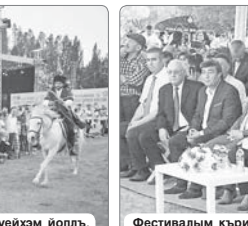
Фестивалым кырихэла кылыкушэуэр.