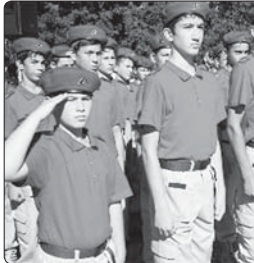
Кыяуяр, Пашадээр 1-нә нал.