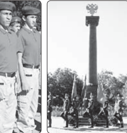
Кыяуяр, Пашадээр 1-нә нал.