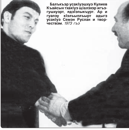
Балъкър усакулъшхуэ Кулиев Къайсын тхакъуэ шалэхэр игъэгушхуэр, ядэлъныкър. Ар и уагъуэ кълъыгъыр адыгъ уагъуэ Семён Руслан и творчеств. 1973 гъэ