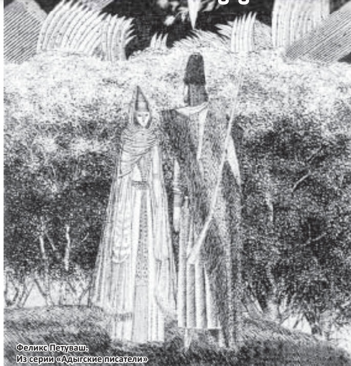
Феликс Петуаш. Из серии «Адыгские писатели»

Основным местом общения молодых людей служили торжественные мероприятия, где они были пространственно несколько изолированы от старшего