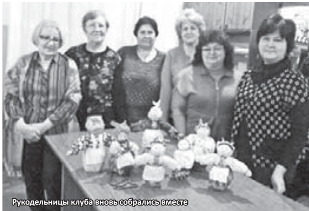
Рукодельницы клуба вновь собрались вместе