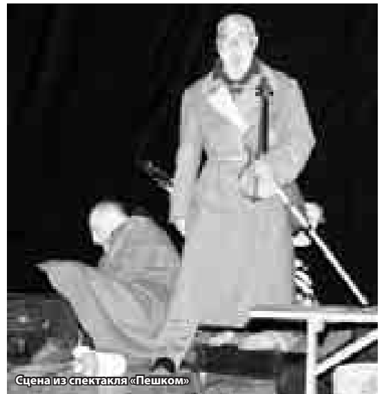
Сцена из спектакля «Пешком»

25 ОКТЯБРЯ В НАЛЬЧИКЕ ОТКРЫЛСЯ ШЕСТОЙ МЕЖДУНАРОДНЫЙ ФЕСТИВАЛЬ СИМФОНИЧЕСКОЙ МУЗЫКИ ИМЕНИ ЮРИЯ ТЕМИРКАНОВА, ЗАКРЫТИЕ КОТОРОГО СОСТОИТСЯ 1 ДЕКАБРЯ. ЭТО МАСШТАБНОЕ МЕРОПРИЯТИЕ ПРОХОДИТ В РЕСПУБЛИКЕ ПРИ ПОДДЕРЖКЕ МИНИСТЕРСТВА КУЛЬТУРЫ РОССИИ И КАБАРДИНО-БАЛКАРИИ.