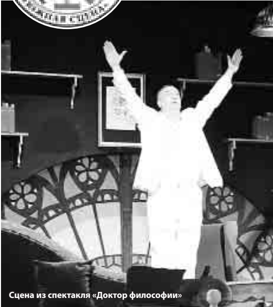
Сцена из спектакля «Доктор философии»