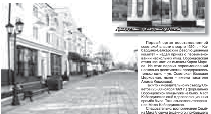
Арка в Станице Екатеринбургской

Начало улице Кабардинской дала дорога, которая вела от Екатеринбургских ворот до Нальчикской крепости, пересекая её форштадт (предмесье).