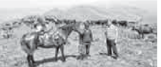
(Окончание. Начало на 1-й с.)