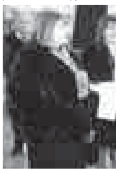
для каждого направления состязаний.

В перечень компетенций чемпионата также направлены, как облицовка плиткой, кирпичная кладка, сварочные технологии, парикмахерское искусство, поварское дело, технологии моды, дошкольное воспитание, преподавание в младших классах, ремонт и обслуживание легковых автомобилей, эксплуатация сельскохозяйственных машин.