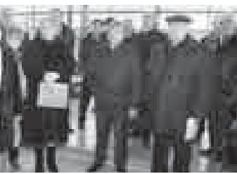
Организованы курсы обу-

Открывая встречу, Нина Емзуова отметила, что это первый региональный чемпионат такого масштаба, где все направления будут