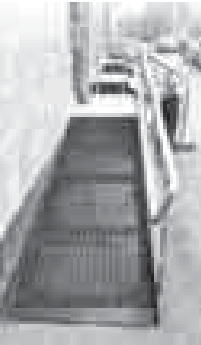
либо через многофункциональные центры. Подготовил Владимир АНДРЕЕВ

Предоставляемые Пенсионным фондом государственные услуги людям с ограниченными возможностями здоровья могут получить в электронном виде без личного визита в органы ПФР с помощью сервиса «Пичный кабинет гражданина» (размещен на официальном сайте ПФР)