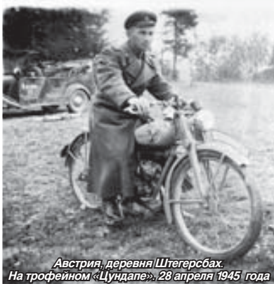
Австрия, деревня Штегерсбах. На трофейном «Цундапе». 28 апреля 1945 года