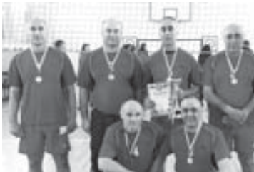
Победили нальчикские ветераны

В селе Верхняя Балкария прошёл традиционный волейбольный турнир, посвящённый Дню возрождения Балкарского народа.