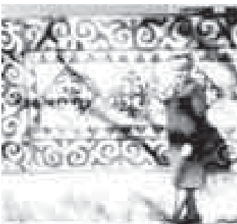
этнокультуры, мы не имеем в виду возврат к прошлому, а вернее речь о возрождении традиций и их разумном развитии в современных условиях.