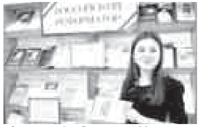
Выставка, посвященная Петру Аркадьевичу Столыпину - это ещё один штрих к многообразной деятельности Государственной национальной библиотеки...

вернуть страну к прогрессу вместе с решением и вопроса финансирования армии - оплота безопасности Российской империи.