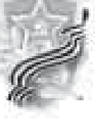
(Окончание. Начало на 1-м)

...Война – тяжелая и страшная мужская работа, которая требует от каждого предельной внимательности, ответственности, но и здорового авантюризма, смеливости и способности работать в коллективе. Экстремально тяжёлые условия, постоянная смертельная опасность выявляют в каждом самые потаённые качества характера, могут раздвинуть человеческую душу, а могут выковырять целую самодостаточную личность, эталон нравственных качеств, на который можно было равняться, да и сейчас остаётся окружающим. Приход очень суровую во-