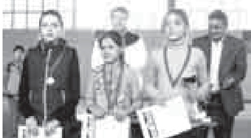
Три младшие группы – ребята и девочки 2003-2008 годов рождения – соревновались в дублорье. Это бег и плавание на разные дистанции. Старшие плавали и участвовали в так называемом «комбайне»: бег на 2400 метров с трем огневыми рубежами.

Открытое первенство Кабардино-Балкарии по современному пятиборью, проходившее под флагом физкультурно-спортивного общества «Динамо», собрало почти сто сорок спортсменов из Кабардино-Балкарии и Ставропольского края.