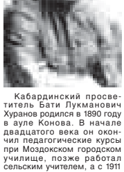
Кабардинский просветитель Бати Хуранов родился в 1890 году в ауле Конова.

Объединение кавказских народов с Российским государством как военно-политическое образование дало толчок к развитию многих отраслей промышленности, экономики, социальной сферы, народного образования и культуры.