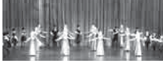
Уважаемые жители и гости Республики!

24 мая на улице Кабардинской Нальчика (напротив кинотеатра «Победа») состоится праздничное мероприятие, посвящённое Дню славянской письменности и культуры. По традиции, сложившейся в последние годы, под лозгом многих регионов России в Калининграде одновременно проходит всероссийский праздничный концерт. В программе концерта — песни, танцы, выступления хоровых коллективов. Начало в 13 часов. Вход свободный.