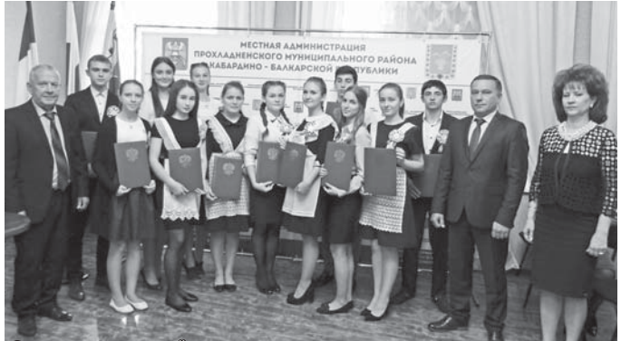
Состоялась 20-я юбилейная церемония вручения премии главы местной администрации Прохладненского муниципального района талантливым и одарённым детям 4-9 классов 2017 года.

Поддержать одарённых ребят, преуспевших не только в учёбе, но и в творчестве, искусстве, спорте, в этот день пришли руководители структурных подразделений районной администрации, главы сельских администраций, руководители общеобразовательных учреждений и родители.