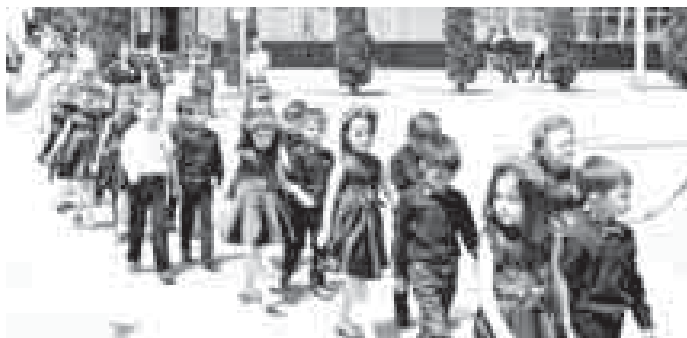
*** Руководители и сотрудники Госавтоинспекции столицы

региона не оставили без внимания детей, проходящих реабилитацию после дорожно-транспортных происшествий. Во время мобильных тре-