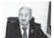
Подготовка формы списка граждан с ограниченными физическими возможностями...

В Нальчикской территориальной избирательной комиссии в форме делового диалога прошёл «КРУГЛЫЙ СТОЛ», посвящённый предстоящим в марте 2018 года выборам Президента Российской Федерации. В соответствии с Конституцией РФ глава государства будет избран путём прямого всеобщего тайного голосования на шестилетний срок.