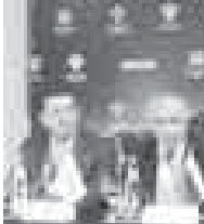
Министр культуры Республики Кабардино-Балкария...