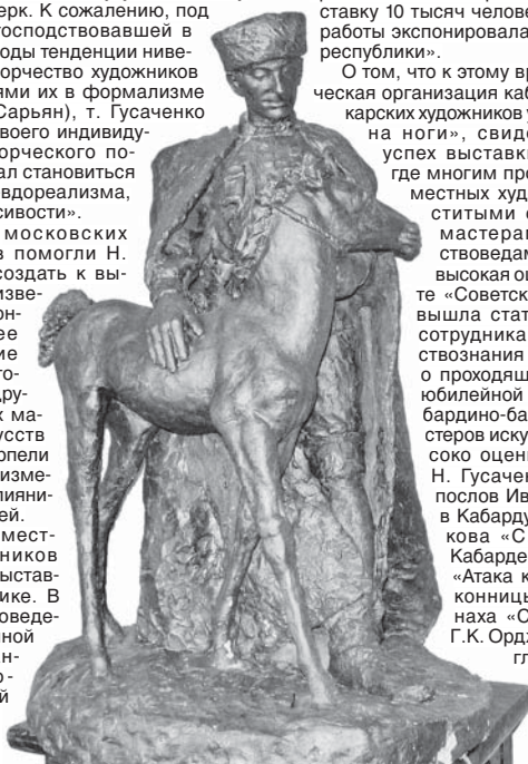
Ф. Калмыков. Конеvod Кабарды