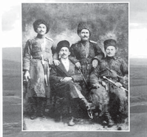
ИЗ ИСТОРИЧЕСКОГО ПРОШЛОГО МАЛОКАБАРДИНСКОГО СЕЛЕНИЯ ИСЛАМОВО (1832—1989)

села Верхний Курп. Неутомимый, цепкий, удачливый в поиске необходимого документа, он быстро завоевал авторитет в «клубе». Детское увлечение историей переросло в смысл жизни. Он стал профессиональным историком, кандидатом исторических наук, научным сотрудником Академии наук Украины. В силу известных событий в Киеве в 2014 г. вынужден был переехать в Санкт-Петербурге.