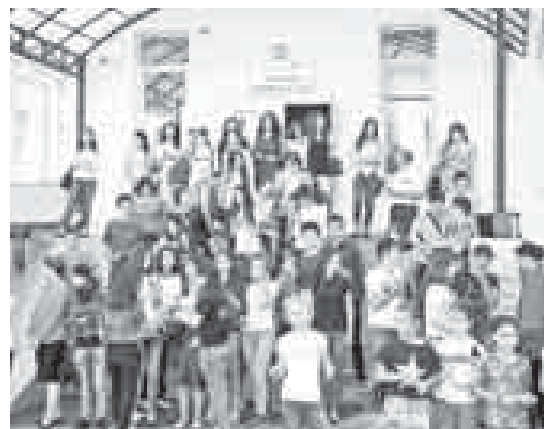
М. ЯРОСЛАВСКАЯ.

Глава КБР поздравил студентов, профессорско-преподавательский коллектив вуза с началом нового учебного года, пожелал дальнейших достижений в научной деятельности, освоении избранной специальности. «Проявляйте интерес к учебе, знаниям. Это те шаги, которые обязательно будут востребованы и республикой, и страной», – подчеркнул руководитель региона.