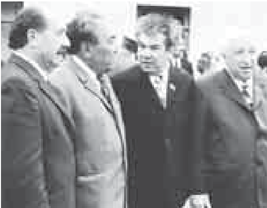
Кайсын Кулиев, Давид Кугультинов, Мустай Карим, Расул Гамзатов

В Нальчике 14 сентября в Музыкальном театре состоялось открытие перекрёстных трёхдневных гастролов Башкирского молодёжного театра из Уфы. Утром 15 сентября вернулась с ответных гастролов труппа Балкарского драматического театра им. К. Кулиева.