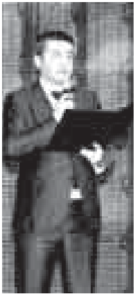
Организатором фестиваля выступило Министерство по национальной политике, внешним

В ГОСУДАРСТВЕННОМ КИНОКОНЦЕРТНОМ ЗАЛЕ ПРОШЛА ТОРЖЕСТВЕННАЯ ЦЕРЕМОНИЯ НАГРАЖДЕНИЯ VI ВСЕРОССИЙСКОГО РАДИОФЕСТИВАЛЯ «ГОЛОС КАВКАЗА», ПОСВЯЩЕННОГО ПАМЯТИ ПЕРВОГО ПРЕЗИДЕНТА ЧЕЧЕНСКОЙ РЕСПУБЛИКИ, ГЕРОЯ РОССИЙСКОЙ ФЕДЕРАЦИИ АХМАТ-ХАДЖИ КАДЫРОВА.