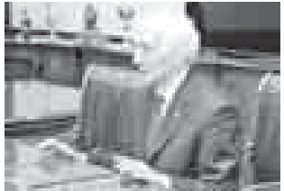
М. ЯРОСЛАВСКАЯ.

А.М. Кумахов выразил признательность руководству Кабардино-Балкарии за оказанную поддержку в проведении международной альпиниады «Эльбрус-1967-2017», посвящённой 50-летию первого массового восхождения на высочайшую вершину Европы.