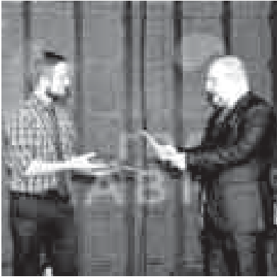
грамма» и «Утреннее шоу». Всего на «Голос Кавказа» поступили работы представителей более ста радиостанций. Были учреждены

Награды фестиваля присуждались в трёх номинациях: «Ежедневная информационная программа», «Тематическая про-