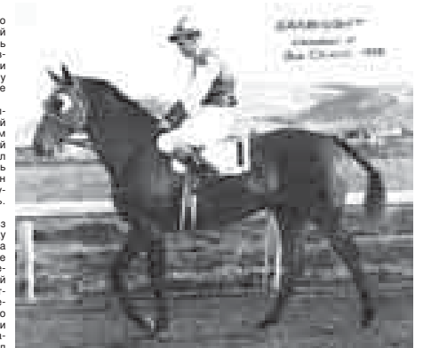
Сухарь и Чарльз Говард на скаковом турнире в Калифорнии.