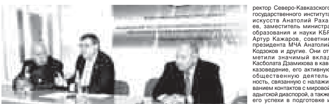
После пленарного заседания участники конференции работали в трех секциях: «Народы Кавказа и процессы формирования многонационального Российского государства: проблемы интеграции и взаимопонимания»; «Социологические взаимодействия в политическом российском обществе»; «Этнолингвистические процессы в современном российском обществе».

пленарным заседанием и пленарными заседаниями ИГИ КЕНЦ РАН, подготовленных в рамках празднования 460-летия, представлено более 50 докладов и сообщений как местных авторов, так и учёных из Адыгеи, КЧР, Республики Дагестан, РСО-Алания, Москвы, Санкт-Петербурга, охватывающих самый широкий спектр вопросов.