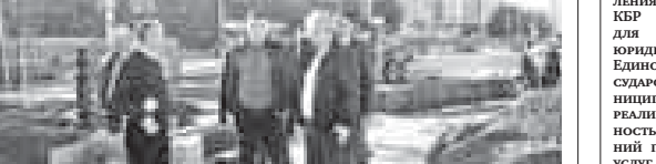
Депутат Государственной Думы РФ, региональный координатор партийного проекта «Единой России» «Городская среда» Адальби Шхагошев проинспектировал ход реконструкции площади перед Дворцом культуры профсоюзов на проспекте Кулиева.

«Единая Россия» настаивает именно на этом механизме, иначе результат может понравиться не всем жителям города.