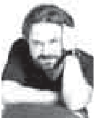
Кадр из сериала «Спящие»