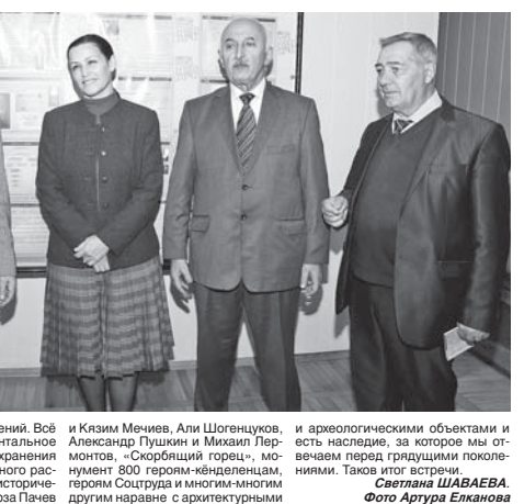
В Кизим Мечеве, Али Шогенов, Александр Пушкин и Михаил Лермонтов, «Скорбящий горец», мюнхен 500 герман-кёндельцанд, герои Союзная и многим-многом другим нарване с архитектурными и археологическими объектами и есть наследие, за которое мы отвечаем перед грядущими поколениями. Таков итог встречи. Светлана ШАБАЕВА