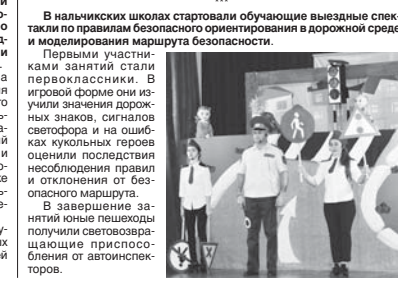
Материалы рубрики подготовил Альберт ДЫШКОВ

Школьники Майского района организовали выпуск тематических школьных газет, освещающих актуальные аспекты в сфере безопасности дорожного движения, участие школьников района в акциях с Госавтоинспекцией и деятельность школьных отрядов юных инспекторов движения. Развивать школьную систему обучения основам дорожной безопасности через популяризацию собственных печатных изданий автоинспекторы и педагоги планируют на постоянной основе.