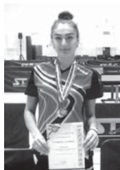
Материалы рубрики подготовил Альберт ДЫШКОВ

Одной из «фишек» бархатного сезона в Сочи стал именной турнир почти полувековой традиции по настольному теннису. Очередной, 47-й сочинский турнир собрал многих известных теннисистов, поскольку эти состязания третьи по значимости после чемпионата и Кубка России.