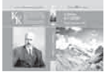
Роллан Сейсенаев – выдающийся казахский писатель, драматург, переводчик, издатель, общественно-политический деятель Казахстана.

О Кайсыне Кулиеве делится воспоминаниями Роллан Сейсенаев, который приглашен в Нальчик на торжественные 100-летие народно-поэта Кабардино-Балкарии, лауреата Государственных премий РФСФР и СССР, лауреата Ленинской премии.