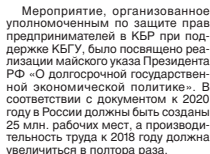
Мероприятие, организованное уполномоченным по защите прав предпринимателей в КБР при поддержке КБТУ, было посвящено реализации майского указа Президента РФ «О долгосрочной государственной экономической политике».

(Окончание на 2-й с.)