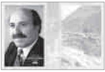
Лирические, в основном любовные стихотворения, так и оформление: мелованная плотная бумага, многокрасочная печать...