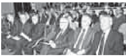
Мероприятие открыл первый заместитель Председателя Правительства – министр сельского хозяйства КБР Сергей Говоров.

Мероприятие открыл первый заместитель Председателя Правительства – министр сельского хозяйства КБР Сергей Говоров. Он подчеркнул актуальность темы конференции, заметив, что создание высокопроизводительных рабочих