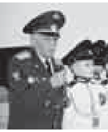
Присяга – священный ритуал для каждого защитника Отечества всех поколений. Происноса клатву преданности Родине, юности всем сердцем верят в то, что подписываются под каждым ее словом, отвечают за каждый свой поступок.

В колледже искусств СКГИИ состоялась торжественная церемония посвящения в кадеты учащихся пятого класса музыкального кадетского корпуса Северо-Кавказского государственного института искусств.