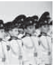
Присяга – священный ритуал для каждого защитника Отечества всех поколений. Происноса клатву преданности Родине, юности всем сердцем верят в то, что подписываются под каждым ее словом, отвечают за каждый свой поступок.