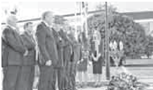
Разделить радость с коллективом АГУ приехали представители двадцати университетов, научных учреждений России и других государств. День начался с церемонии возложения цветов к месту, где будет установлен памятник 1992-1993 г.