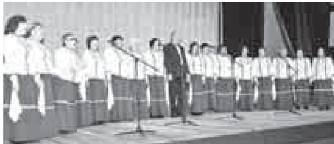
района и народный казачий хор «Родник» Нальчика.

ЗАВЕРШАЮЩИМ МЕРОПРИЯТИЕМ МЕСЯЧНИКА ПОЖИЛОГО ЧЕЛОВЕКА, КОТОРЫЙ ЕЖЕГОДНО ПРОВОДИТСЯ В НАШЕЙ СТРАНЕ В ОКТЯБРЕ, СТАЛ ПЕРВЫЙ РЕСПУБЛИКАНСКИЙ ВОКАЛЬНЫЙ КОНКУРС, ОРГАНИЗОВАННЫЙ РЕСПУБЛИКАНСКИМ СОЮЗОМ ПЕНСИОНЕРОВ ПРИ ПОДДЕРЖКЕ МИНИСТЕРСТВА КУЛЬТУРЫ КБР И АДМИНИСТРАЦИИ МУНИЦИПАЛЬНЫХ РАЙОНОВ И ГОРОДСКИХ ОКРУГОВ НАШЕГО РЕГИОНА. ПРОГРАММУ КОНКУРСА, КОТОРЫЙ ПРОШЁЛ В ГОСУДАРСТВЕННОМ КОНЦЕРТНОМ ЗАЛЕ, СОСТАВИЛИ ВЫСТУПЛЕНИЯ САМОДЕЯТЕЛЬНЫХ ЛЮБИТЕЛЬСКИХ ХОРОВ И АНСАМБЛЕЙ, А ТАКЖЕ ОТДЕЛЬНЫХ ИСПОЛНИТЕЛЕЙ.