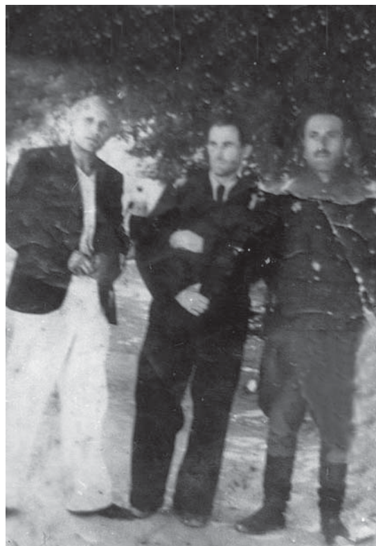
Кайсын Кулиев в госпитале проходит курс лечения. 1943г.

Сам поэт так охарактеризовал этот период: «...Тяжёлые испытания, часто не дающая удовлетворения работа, постоянная боль и горе не способствуют сохранению